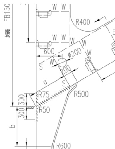
(12) 舷侧肋骨与船体外板和顶边舱(底边舱)斜板的连接