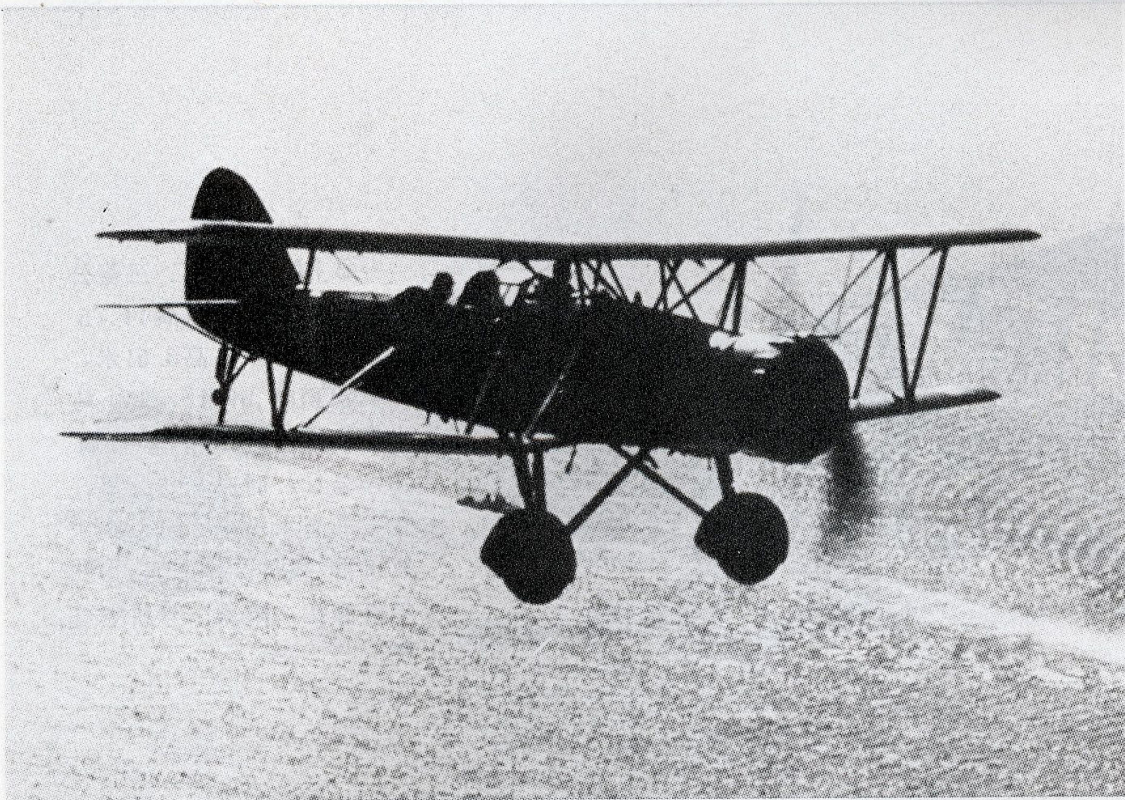
B 4 Y1 96式 横须贺 海军工厂制造，双翼。翼 展15米，长10.15米，高 4.36米，机翼面积49.98 米 2 ，光2型发动机1台，700 马力，起飞重量3600公斤， 时速278公里，装7.7毫米机 枪1挺，载1枚鱼雷。乘员 3名。1935年装备航空母舰。