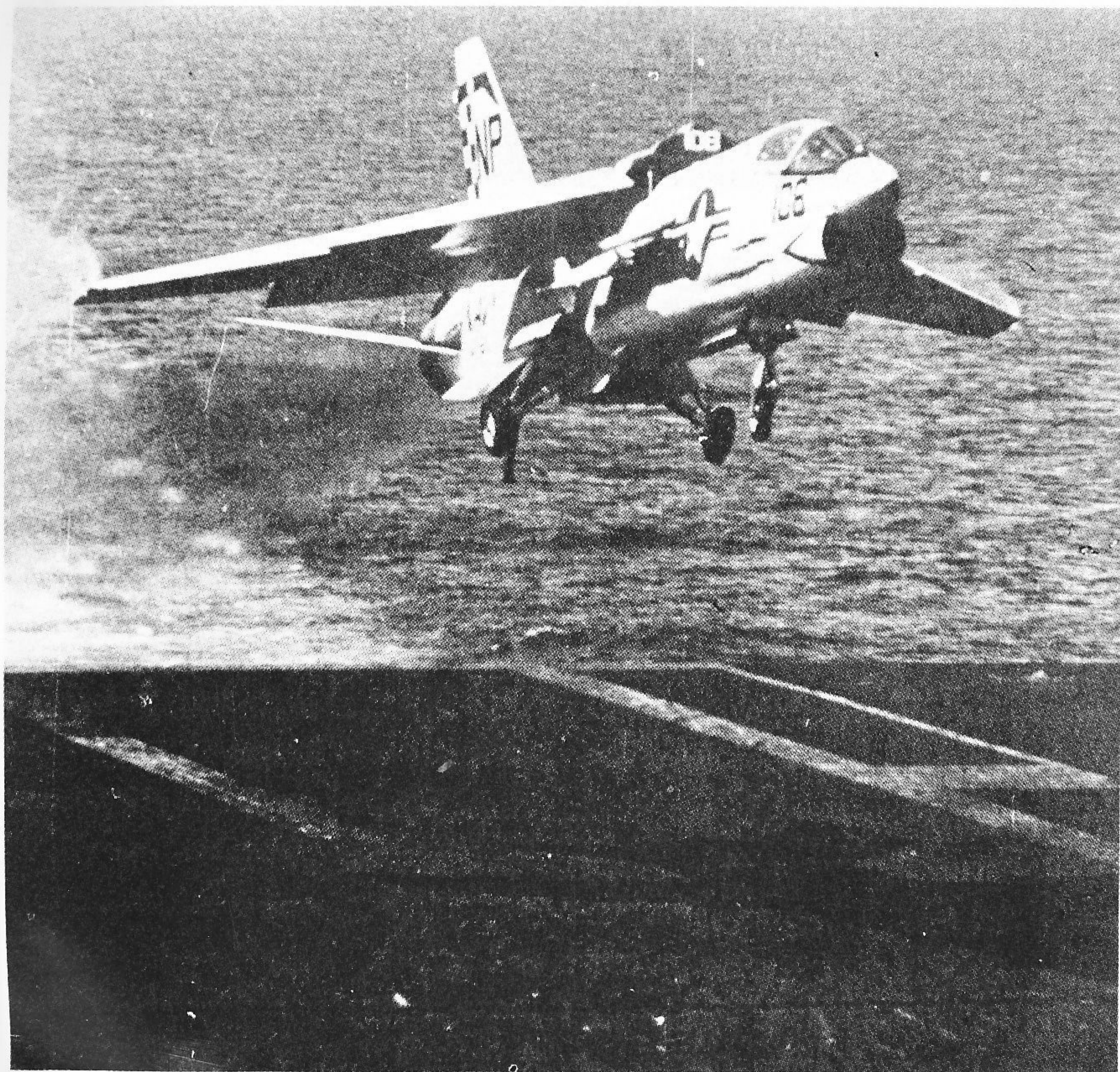
F-8C Crusader“十字军战 士”是沃特公司根据海军要求设 计的一种超音速制空战斗机，图为 1967年5月VF-211中队的一架F- 8E在“好人理查德”号上降落。翼 展10.72米，机长16.61米，最大起 飞重量15吨，最大平飞速度M2.01， 装4座20毫米炮，4枚“响尾蛇” 空空导弹。